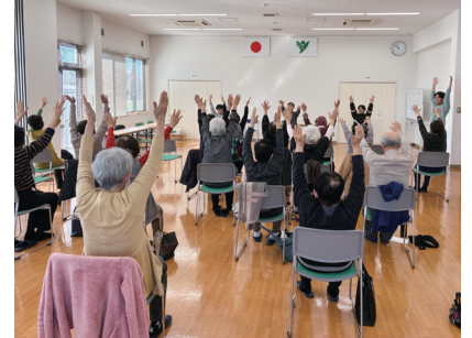
▲豊原いきいきサロン（豊原地区社協）