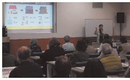
▲人と家の終活講座の様子

みなさん真剣に話に聞き入れられ「今抱えている悩み解決のヒントがあった。」「自分が元気なうちに何をしたらよいか学べてよかった。」「家族と講座で聞いたことを話したい。」等の感想が聞かれました。