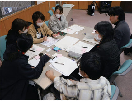
▲グループワークの様子