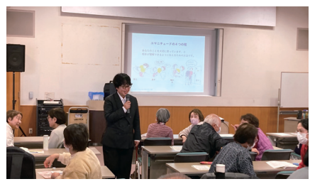
▲ユマニチュード講演会の様子

受講されたみなさんからは、「やさしさを伝える技術を学べてよかった。」「ちよつとの気遣い（やさしさ）を大事に人と接していきたい。」等の感想がありました。