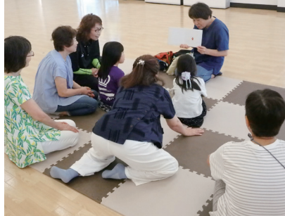
▲子育てサロン（血垣地区社協）