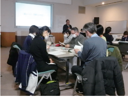
▲強度行動障がい研修の説明の様子