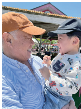
▲令和7年度最優秀賞作品 「じいじ だあいすき」

※入賞作品は、「やながわ福祉のつどい」{令和8年11月28日（土）}にて表彰いたします。