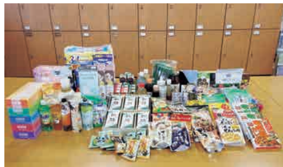
集まった食料品、日用品の一部

2 月 10 日 (金)、藤吉コミュニティセンターでボランティア体験会「フードドライブ」を開催しました。