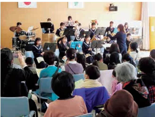
▲蒲池中吹奏楽部の演奏に聞き入る来場者