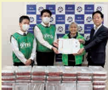
▲左から(株)ダイナム様、森田会長、本会事務局長

様は、わいわい食堂開催日に従業員の方々が交代でボランティアに ランティアに参加されています。