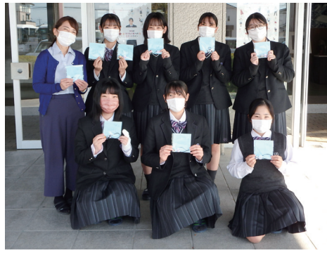
▲杉森高校福祉科の生徒さん

11月17日(木)、杉森高校福祉科の生徒様から、くみボタンで作成したマグネットやヘアゴムを寄贈していただきました。福祉科では、11月11日の「介護の日」を通して、介