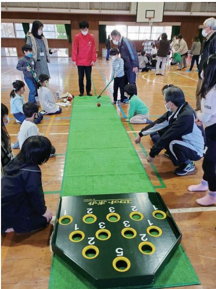
▲レクリエーション大会の様子