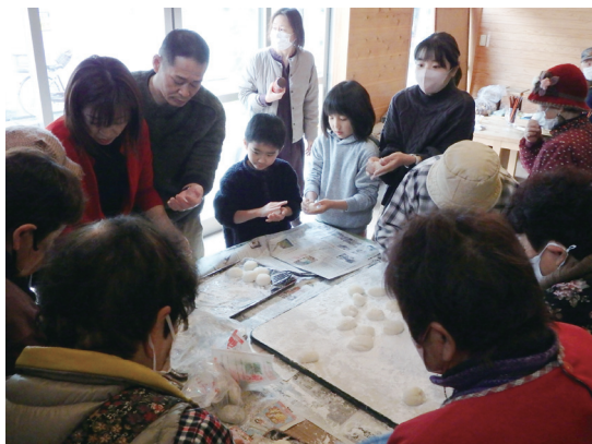
▲12/25(日)年末恒例餅つき大会が行われました

詳細については、ホームページをご覧ください。(ちなみに、「300円食堂」が助成金交付第1号です。)