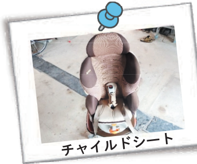
チャイルドシート

https://yanagawa-shakyo.or.jp/hand_over/