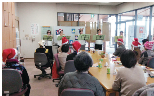
▼水の郷2階「ゆゆうプラザ」にて

この日は、ワイワイおしゃべり会の来場者のほか、10月～11月にかけて市社会福祉協議会が開催した傾聴ボランティア養成講座を修了した4人が新たに会員に加わり、楽しい交流会となりました。