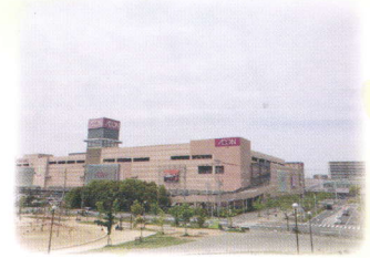
●ショッピングモール