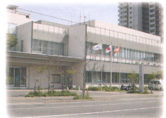
●さいとびあ (西部地域交流センター)