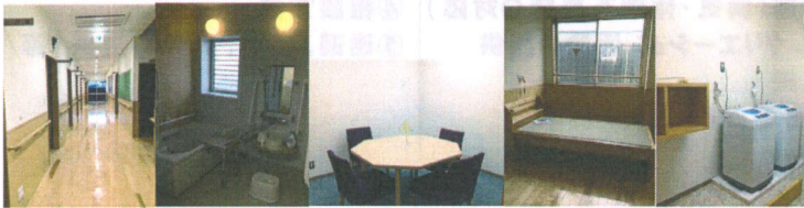
木の香園自立支援センター 案内図