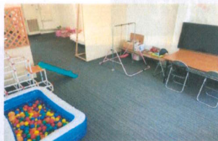
医療的ケアルーム