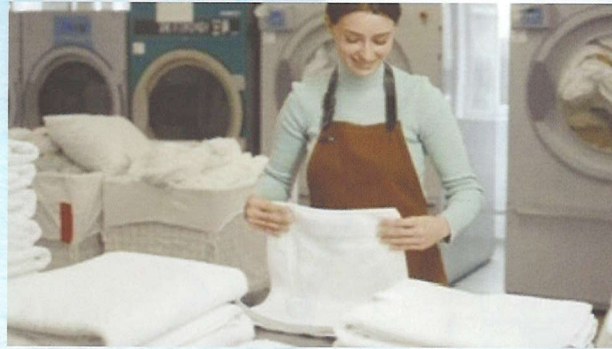
タオル等のたたみ作業