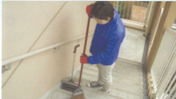
アパートの定期清掃作業