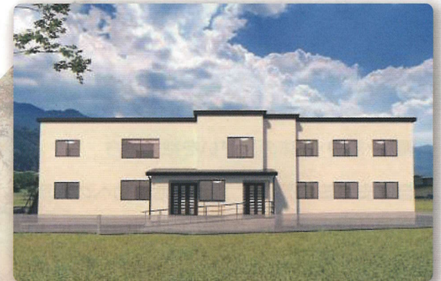
スターホーム(イメージ)