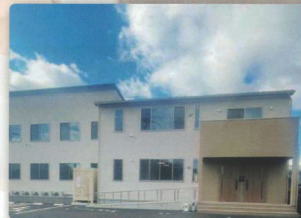
スターホームSETAKA(せたか)