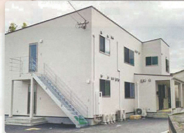
スターホームOMUTA外観