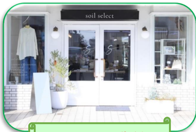
がいかん soil select 外観

メッセージ : ご利用者様の目標や目的を大事にし「卒業できるA型事業所」として将来に向かって活動できます。また、卒業後も定期的サポートを受けることができます。「地域で活躍できる」「地域に貢献できる」「地域とともに成長できる」場所です。楽しく働きたい方、特技を生かしたい方、目標をもちたい方、そんな方のご利用をお待ちしています。