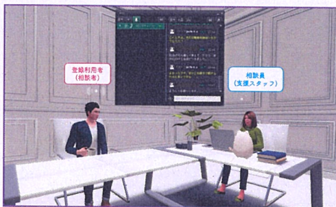
Second Life©アプリ (PCに対応)

今回の実践セミナーは、 上記の方々の支援に携わる県内の公的支援(相談)機関関係者が対象です。