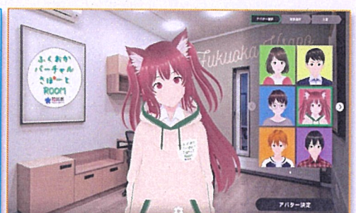
アバター個別相談専用アプリ FukuokaVsapo© (PCとAndroidスマホに対応)

アバター相談の活用に興味はあるもののよく分からない。利用者への周知や説明は？実際にはどのように進めているの？…etc.